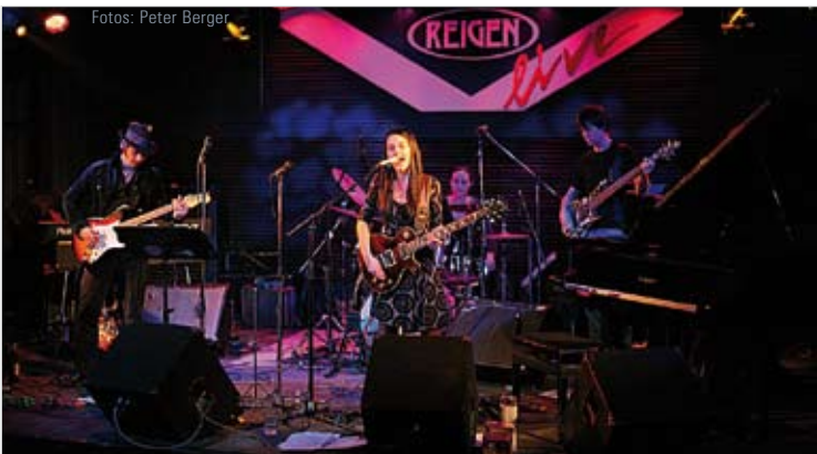
CD-Präsentation der Mary Broadcast Band live am 3. April im Wiener Reigen.

auch noch unterrichten – wobei es natürlich schön wäre, eines Tages nur noch von der Musik leben zu können.